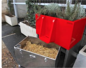
Dans la Ville Rose, on peut faire pipi dans les fleurs