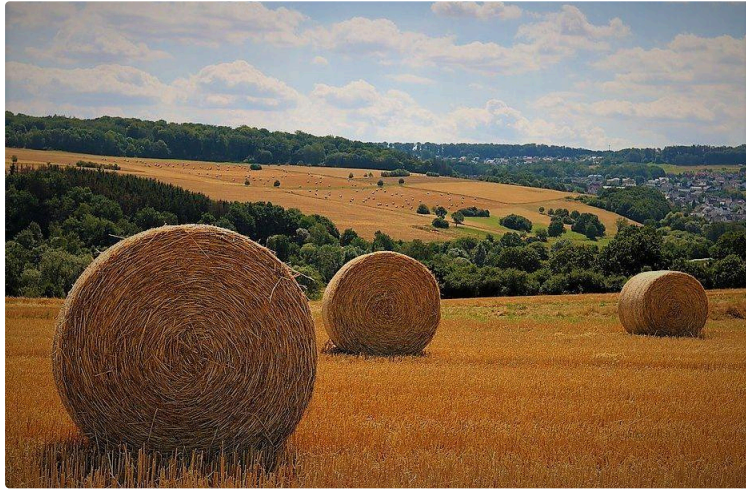
Rendez-vous avec les Bios du Gers-GABB 32

Tous les ans, à l'initiative des Bios du Gers - GABB 32, agriculteurs et professionnels du monde agricole sont invités à venir challenger leurs connaissances et pratiques agronomiques en grandes cultures biologiques.