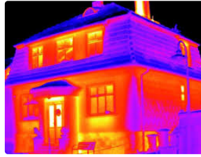
La thermographie pour économiser l'énergie

La communauté de communes Astarac Arros en Gascogne organise la Nuit de la thermographie en collaboration avec le CAUE à