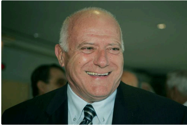
André Daguin, figure emblématique de l'identité gasconne, est décédé

André Daguin, figure incontournable de la gastronomie gersoise, s'est éteint à son domicile, ce mardi 3 décembre, à l'âge de 84 ans. Né le 20 septembre 1935, à Auch, il avait hérité de l'Hôtel de France de ses parents, et en avait assuré la direction jusqu'en 1997.