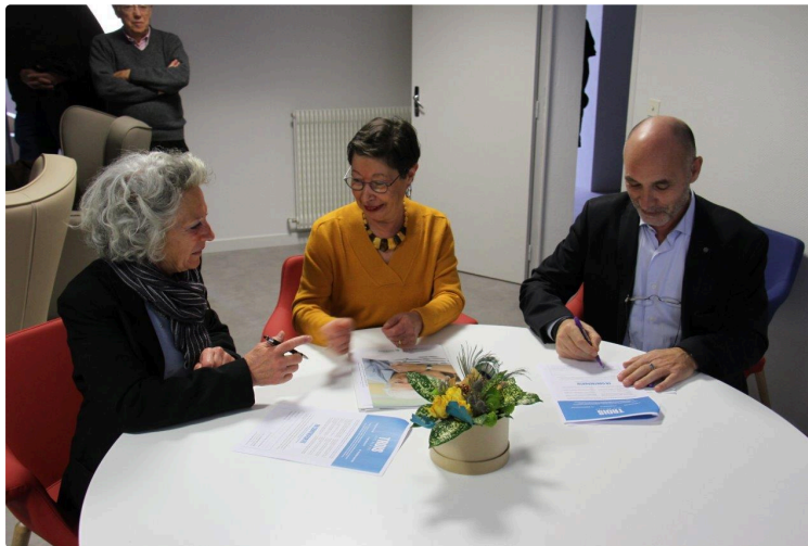
La ville propose un nouvel accueil chaleureux pour les malades d'Alzheimer

Depuis lundi 9 décembre, au 27 avenue d'Aquitaine, Condom offre aux malades d'Alzheimer un accueil de jour ouvert, la semaine, du lundi au vendredi, de 10 h à 17 h dans des locaux fonctionnels et accueillants.