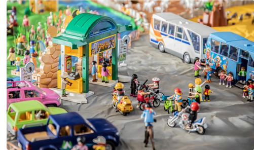
12 En ville 1bis 071219.jpg