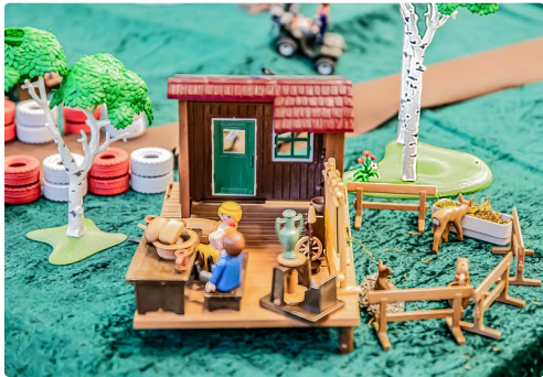
4 A la campagne 1bis 081219.jpg