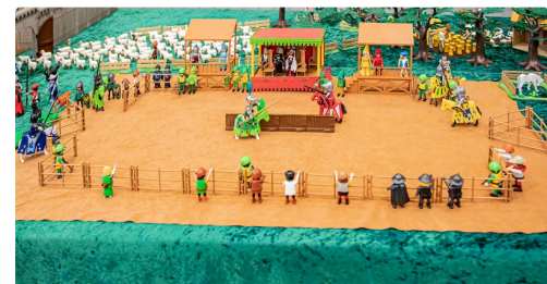
6 Tournoi 1bis 071219.jpg