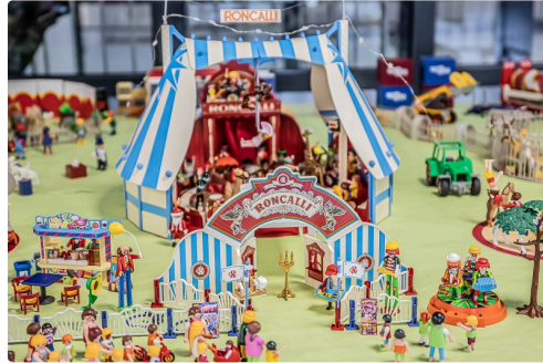
11 Le cirque 1bis 071219.jpg