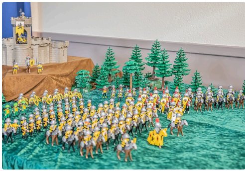
9 Sur le point de livrer bataille 1bis 071219.jpg