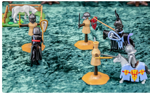
7 Exercice maniement de la lance avec la quintaine 1bis 071219.jpg