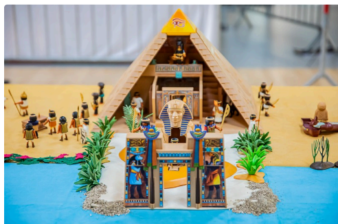
1 Temple égyptien 1bis 081219.jpg

L'association a organisé une autre exposition Playmobil, en août 2018, à Font-Romeu.