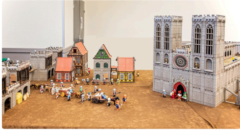
8 Arrivée de soldats en ville 1bis071219.jpg