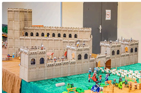
5 Château-fort 1bis 071219.jpg