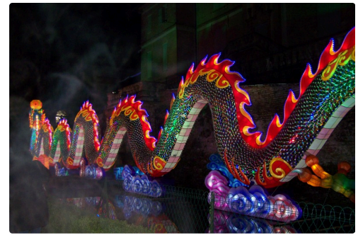
Festival des lanternes à Gaillac 017.JPG