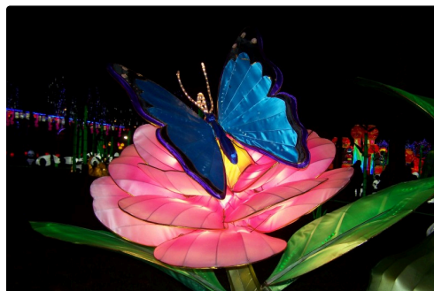
Festival des lanternes à Gaillac 008.JPG