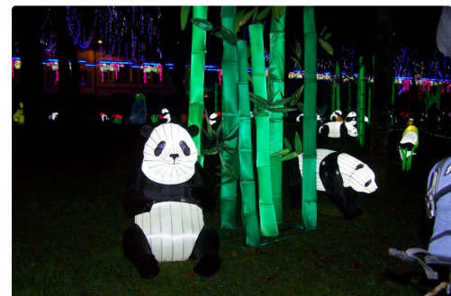
Festival des lanternes à Gaillac 009.JPG