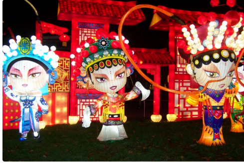
Festival des lanternes à Gaillac 023.JPG