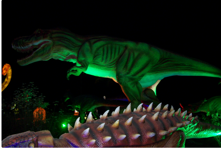
Une soirée féérique au Festival des Lanternes, à Gaillac