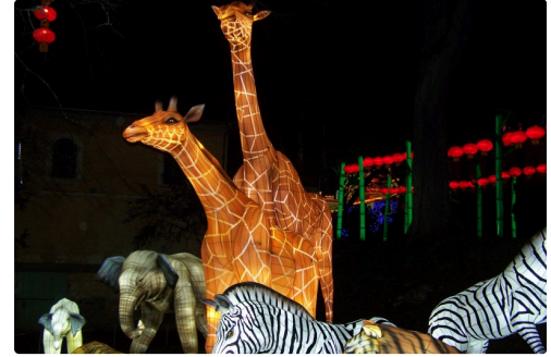
Festival des lanternes à Gaillac 028.JPG