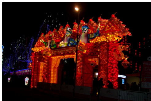
Festival des lanternes à Gaillac 006.JPG

C'est réellement un voyage merveilleux dans le temps, au pays du sourire. En deux ans, 620.000 visiteurs l'ont découvert, cette année encore ils seront éclairés par le charme éblouissant de tous les instants des lanternes magiques.