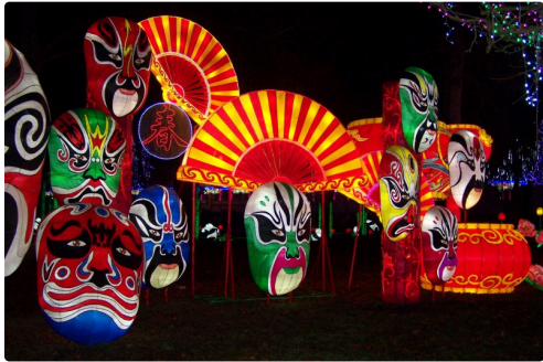
Festival des lanternes à Gaillac 035.JPG