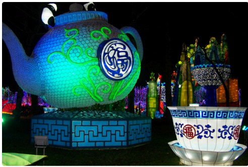
Festival des lanternes à Gaillac 010.JPG