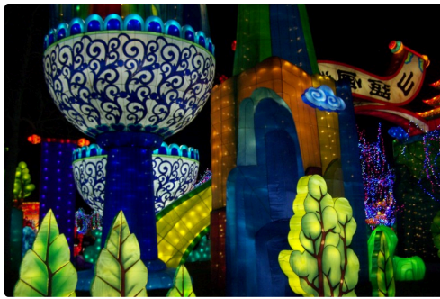
Festival des lanternes à Gaillac 013.JPG