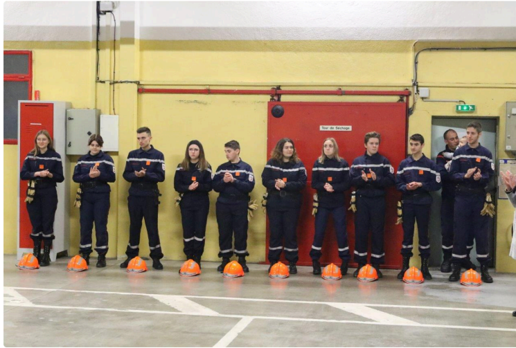
Tradition respectée : les pompiers condomois ont fêté leur sainte patronne

Comme à l'accoutumée, la cérémonie traditionnelle de la Sainte-Barbe en l'honneur de la patronne des sapeurs-pompiers s'est déroulée le samedi 7 février. Sainte Barbe protège de la foudre, mais elle est aussi la patronne, le modèle et la protectrice de nombreuses corporations liées au feu. La Sainte-Barbe est toujours synonyme de festivités et de convivialité. C'est un véritable temps fort de l'année, le moment où les pompiers se retrouvent pour partager des instants de détente, mais aussi une occasion pour être honorés.