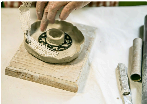
Façonnage d'un bougeoir