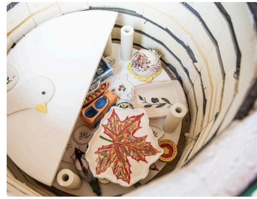
Un des étages du four