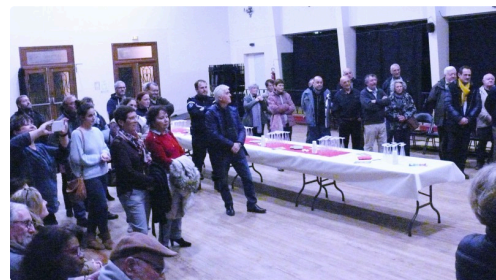
Une partie de l'assistance.