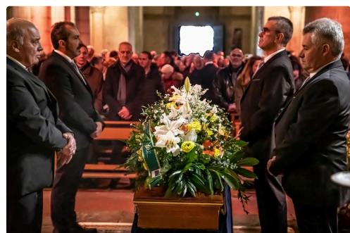
Le cercueil est dans le chœur

je suis seulement passé dans la pièce d'à côté. »