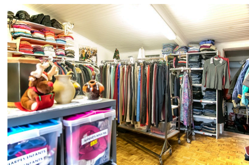
Autre pièce de stockage des vêtements