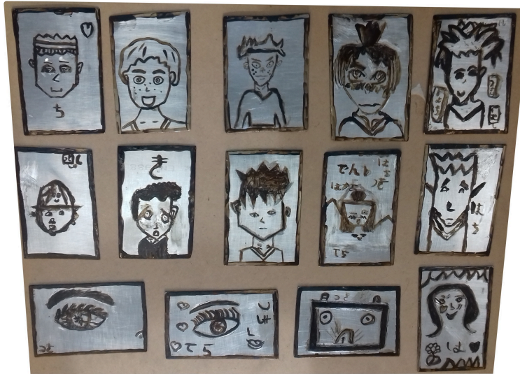
Le vieux fou de dessin et les élèves de CM1 CM2

Un nom à découvrir : Katsushika Hokusai, le plus grand artiste japonais, le maître des estampes, l'inventeur des mangas