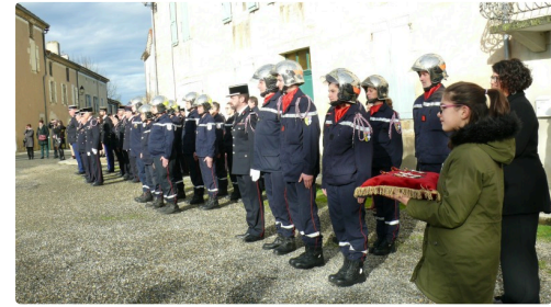
Une partie des pompiers qui assistaient à la cérémonie.