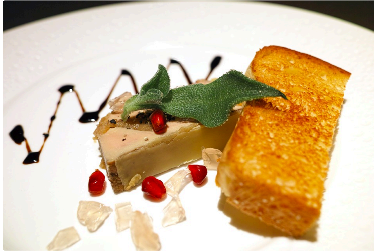
Le foie gras reste le N°1 des fêtes

Malgré les attaques dont il fait l'objet, 92 % des Français en consomment