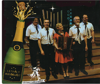
Un grand réveillon avec les Bals mirandais