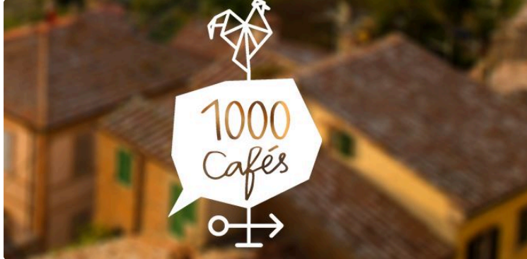
Objectif 1000 cafés de villages !