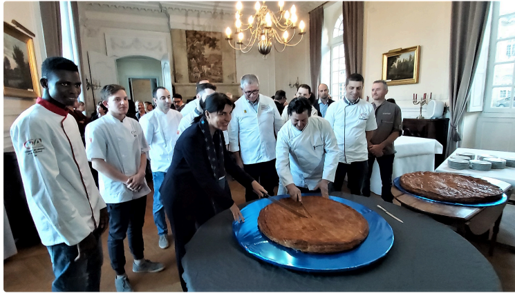
la galette sans fève.