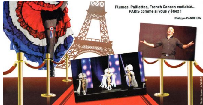
Un gala pour les chiens guides d'aveugles

Une action positive de plus pour le Lion's Club