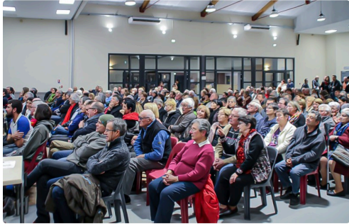
Dans la salle d'animation