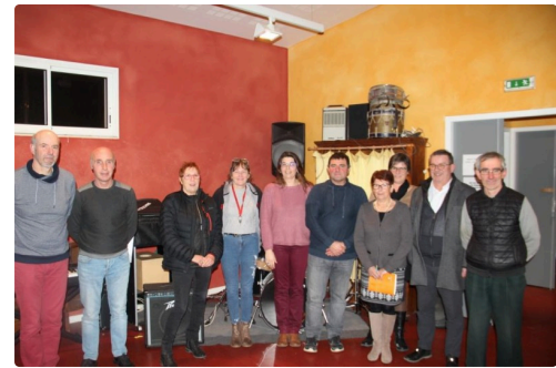
Le conseil d'administration