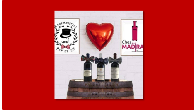
Chez Madiran & Mademoiselle pap' & Cie

Quand deux jeunes entreprises s'associent pour valoriser leur savoir-faire