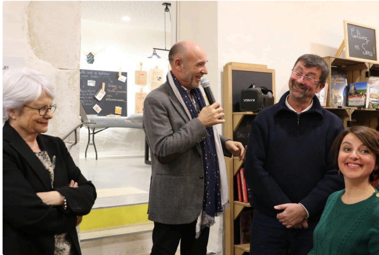
Finies les joutes verbales, ambiance au beau fixe !

Lors de la présentation des vœux à la Fabrique à souvenirs