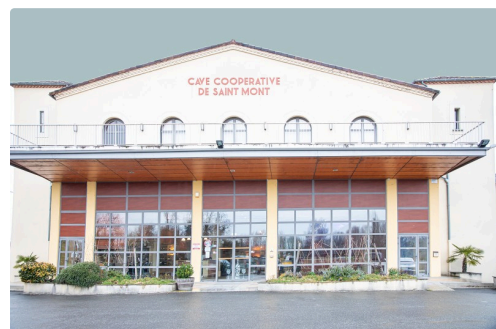
Bâtiment avec boutique, salle de dégustation, salle d'exposition et salle de réunion

(1) Créée par Anto Alquier et son épouse, précédemment liée au collège de Riscle et dissoute en 2018. (2) Modeste, l'intéressé estime que son aventure n'est pas personnelle, mais celle de toute une équipe. (3) ( https://www.lejournaldugers.fr/article/40045-la-cave-de-nogaro-critique-les-incoherences-reglementaires-et-fete-ses-resultats ).