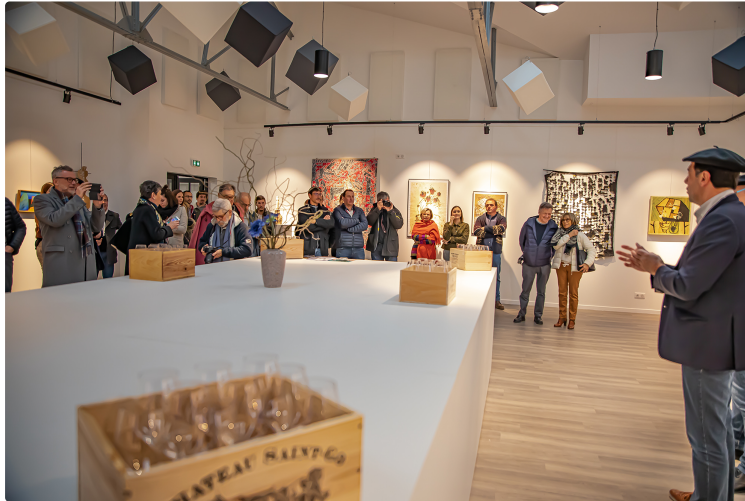
La Galerie bleue renaît à la Cave de Saint-Mont

Plaimont complète ses équipements œnotouristiques