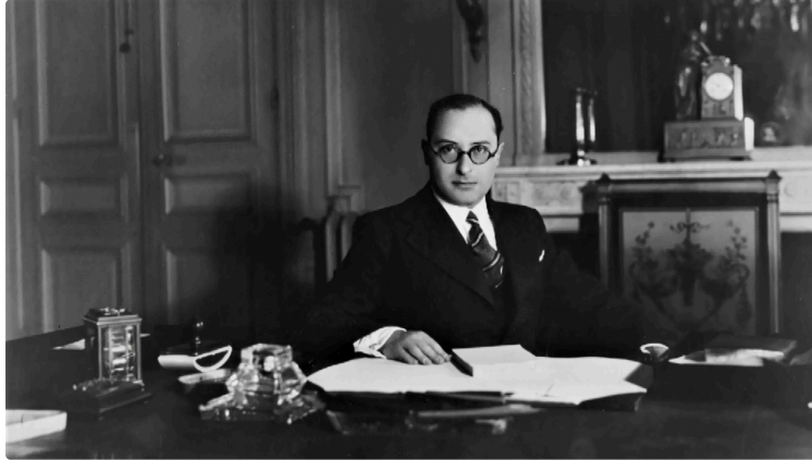
Jean Zay : le grand ministre du front populaire.