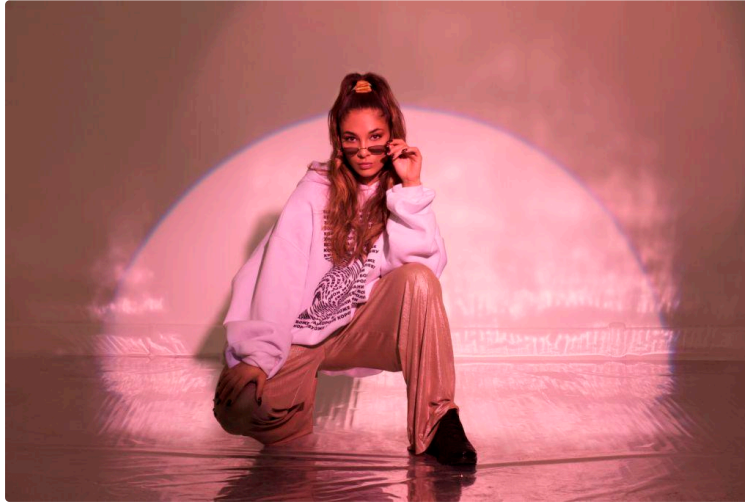
Cri'Art vise le label Scène Musique Actuelle