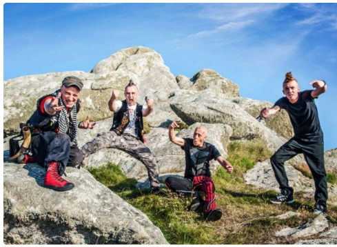
Ramoneurs de Menhir