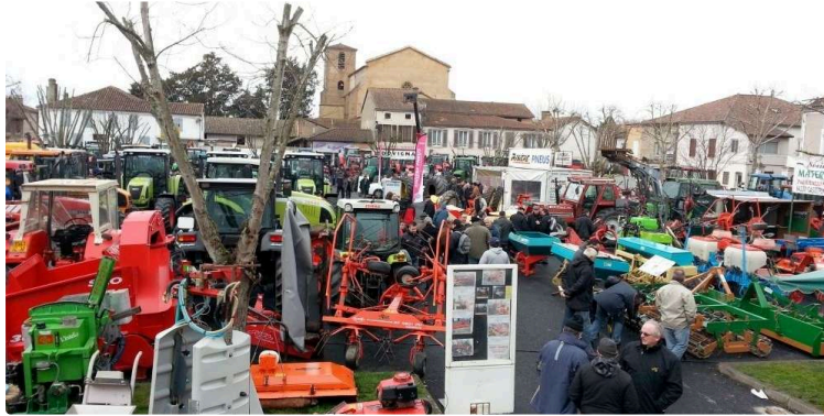
Foire de Barcelonne-du-Gers : l'occasion ou jamais

C'est ce week-end que les visiteurs sont attendus