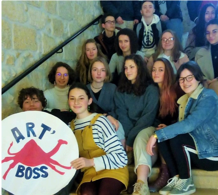
Le premier Café débat lancé avec Art'Boss

Bénéficiant de l'exposition du Palais de la Porte dorée, musée de l'immigration/Paris « BD et immigration... un siècle d'histoire(s) » grâce à la Ligue de l'enseignement au sein du Lycée Bossuet, l'association Art'Boss a lancé son premier café débat, le mardi 28 janvier 2020.