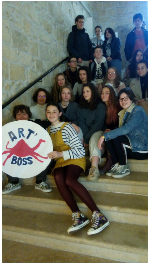
ART BOSS 1.jpg