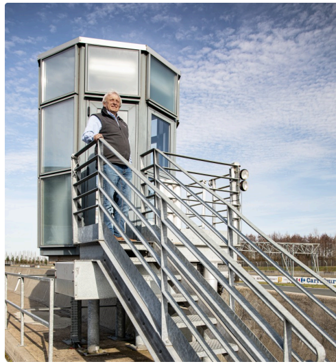
Sur la tourelle de la ligne d'arrivée