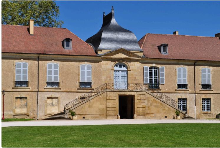
Les châteaux du sud du Gers à l'honneur