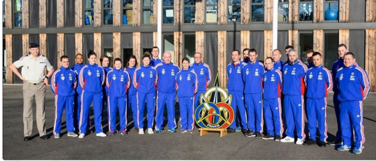
Championnat de France interarmées : l'élite du judo au Mouzon

Les championnats de France interarmées de judo se dérouleront le mercredi 12 février 2020, dès 9 heures, salle du Mouzon, à Auch. Championnats de niveau international avec la présence de membres de l'équipe de France de judo en préparation pour les prochains jeux olympiques de Tokyo. Entrée gratuite.