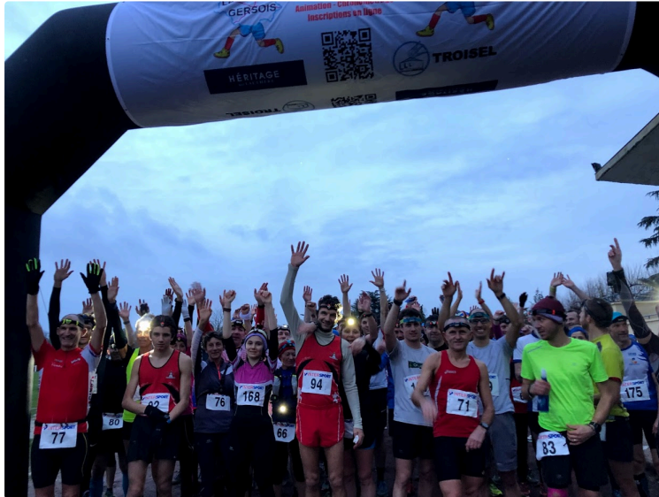
Vous êtes amateur de grand air et de course à pied

Déjà deux courses envolées, si vous souhaitez inscrire votre nom au palmarès du Défi Gersois [1], il n'est pas trop tard. En effet, pour prétendre à une récompense, Monsieur, il vous faudra avoir terminé neuf courses. Moi, faisant partie du sexe supposé faible, deux de moins, à savoir sept. Les handisports seront classés pour leurs résultats à compter de trois épreuves. Le Défi Gersois prend en compte, pour son classement final, sept catégories déterminées par la FFA (Fédération Française d'Athlétisme), en démarrant avec les cadets qui sont les plus jeunes autorisés à courir sur les distances de 15 km. Après cela, en fonction du nombre de courses terminées, de votre âge, un classement final sera établi après la dernière course 2020. Les vainqueurs, comme il se doit, participeront à une cérémonie en leur honneur et allez savoir ! peut-être qu'on devine déjà où elle se déroulera, à Condom, ... à l'Hôtel Le Continental.