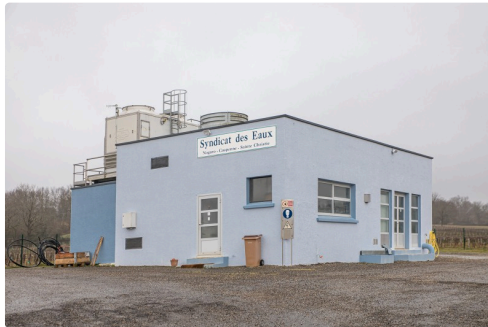
La station du SIAEP