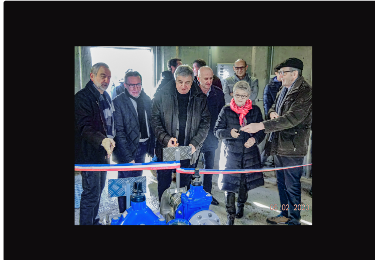
Quel avenir pour l'eau potable après l'interconnexion SIAEP-SIEBAG ?

L'interconnexion entre les 2 réseaux d'adduction d'eau potable – SIAEP (1) et SIEBAG (2) – vient d'être terminée. Elle a été inaugurée le 5 février 2020, en même temps que les travaux de rénovation du château d'eau de Nogaro (celui de Sainte-Christie a été rénové en 2018).