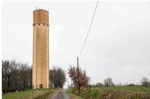
Château d'eau de Lanne-Soubiran