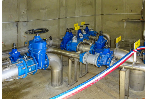
L'interconnexion