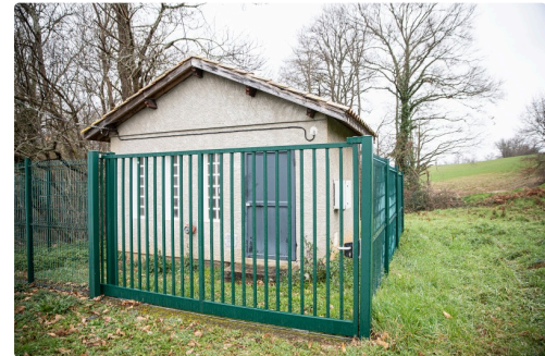
Le surpresseur de Moneton du SIAEP