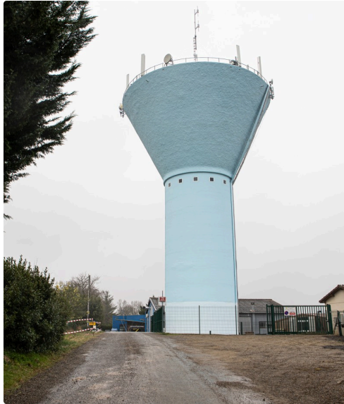
Château d'eau rénové de Nogaro