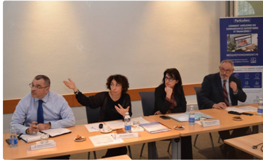
Commission de surendettement : bilan 2019