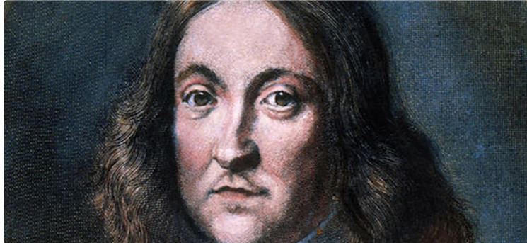
Gens d'ici. Petites histoires de grands

Le mystérieux Monsieur Fermat Saison 1- (2/3)