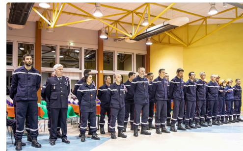
Les sapeurs-pompiers du CIS du Houga