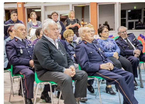
Les anciens sapeurs-pompiers du Houga