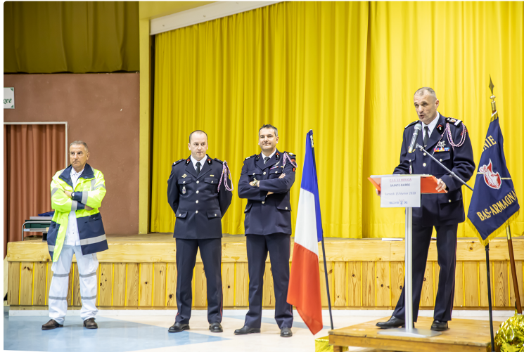
Sainte-Barbe au Houga : un chef de Centre plein de confiance dans l'avenir

Erreur de chiffre sur le nombre d'interventions en 2017 rectifiée le 19.02.2020.