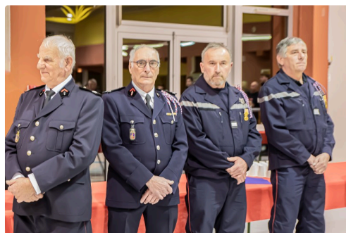
Les anciens chefs du CIS du Houga