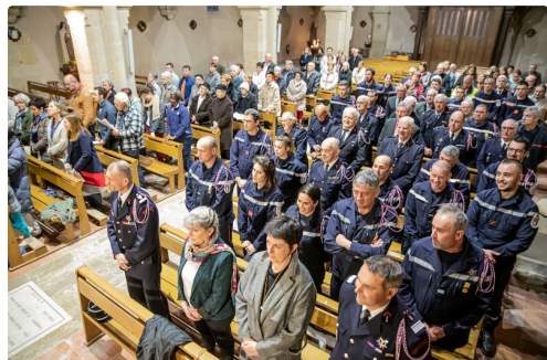
La messe pour les sapeurs-pompiers

(1) Voir le site ( https://www.pompiers.fr/federation/actions/defense-et-representation/volontariat/preserver-lengagement-volontaire-face-la ).