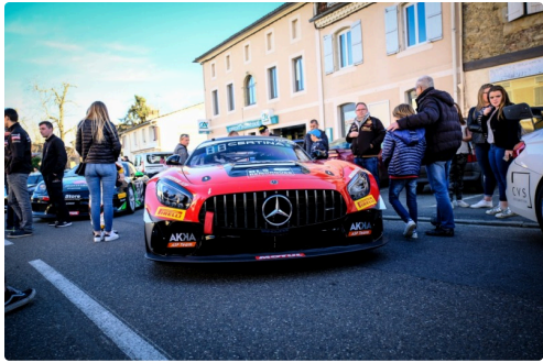
Parade dans Nogaro en 2018