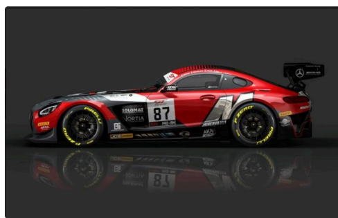
Autre vue de la Mercedes n°87