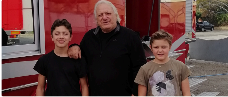
Le cirque Landri : une histoire de famille depuis six générations

À Vic-Fezensac, la place du foirail semble bien vide aujourd'hui. Plus de chapiteau, plus d'animaux exotiques, plus de caravanes rouges. Le cirque Landri a repris la route pour de nouvelles aventures.