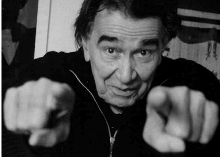
Cinéma de l'Astarac

Cette saison a vu la sortie en salle d'une version restaurée du film « El otro Cristobal » un film à nul autre pareil, chef-d'œuvre du cinéaste anticonformiste Armand Gatti.