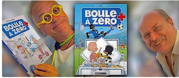
« Boule à zéro », la nouvelle BD de Serge Ernst brise les tabous des enfants hospitalisés

Le dessinateur belge, installé dans le Gers, se confie sur l'évolution de cette bande-dessinée.