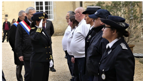
Mme la Préfète salut les délégations.