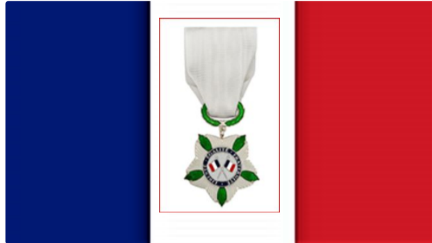
Première Journée nationale d'hommage aux victimes du terrorisme.

« Les victimes du terrorisme sont au cœur de notre fraternité nationale et de notre mémoire. Le 19 septembre 2018, le Président de la République s'était engagé à ce que soit organisée une Journée nationale d'hommage en leur mémoire » dicit l'Élysée. Le 11 mars c'était la première. La date du 11 mars fait référence à l'attentat commis à la gare d'Atocha à Madrid en 2004 . Cette journée d'hommage est profondément européenne et internationale : " Unis dans l'épreuve, unis dans la mémoire ".