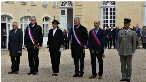
Les autorités présentes.

"Souvenons-nous des victimes du terrorisme. Pensons à leurs familles, à toutes celles et ceux qui ont été blessés dans leur chair, ainsi qu'aux héros qui sont intervenus au péril de leur vie. N'oublions jamais".