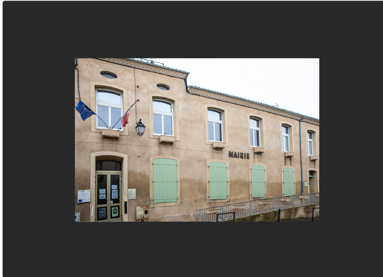
Ça bouge à Nogaro devant la crise sanitaire (mis à jour le 28 mars)

Même si les rues de Nogaro sont désertes, vu que la population observe les consignes de confinement, cela n'empêche pas « la guerre » contre le Covid-19 de battre son plein.