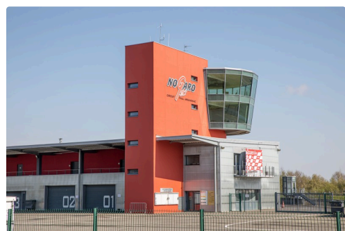
La tour du circuit