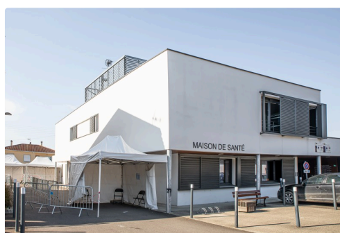
Chapiteaux à côté de la maison de santé