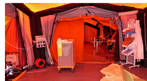
Le PMA : poste médical avancé.

Si vous avez des questions concernant le coronavirus, merci de composer le 0 800 130 000 (appel gratuit) ou de vous rendre sur le site officiel http://Gouvernement.fr/info-coronavirus