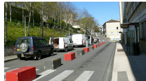
Installation des producteurs sur les allées Baylac.