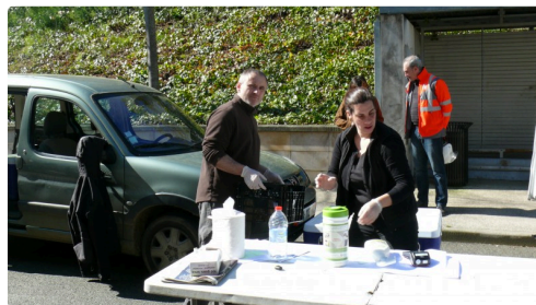
Préparation d'une cagette.