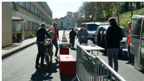
Un consommateur venu à vélo

Pour commander au drive fermier auch CLIC ICI