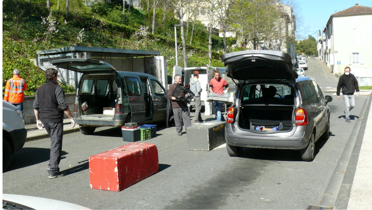
Drive "Zéro piéton" : une première pleine de promesses

Pour un coup d'essai, c'est un coup de maître, le drive « zéro piéton » installé ce samedi matin 4 avril a connu un succès inespéré sur les allées Baylac à l'emplacement de la gare routière. Ce lieu a réuni huit producteurs locaux venus apporter leurs «colis» commandés par 80 consommateurs qui ont été ravitaillés sans sortir de leurs voitures.