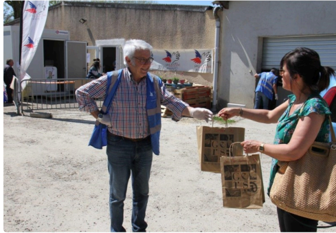
Une bonne nouvelle : la distribution de masques, enfin !