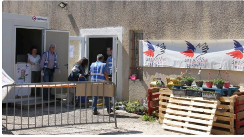
La distribution s'organise en extérieur pour respecter les règles de distance