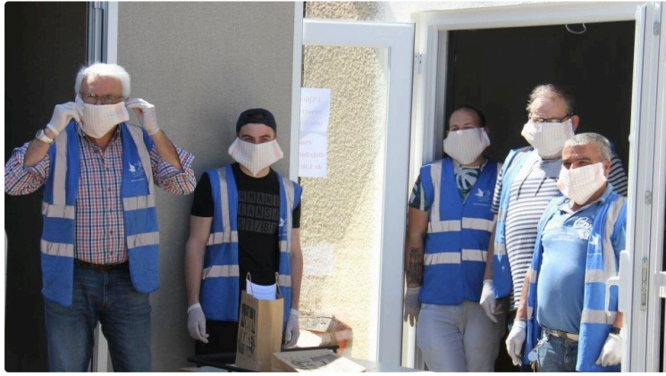
« On est en train de vider les greniers »

Jeudi, une équipe de bénévoles du Secours Populaire gersois est venu distribuer les paniers alimentaires aux personnes les plus démunies. Une initiative que le soleil printanier de ces dernières semaines facilite, puisque les lieux recevant le public ont dû être fermés.