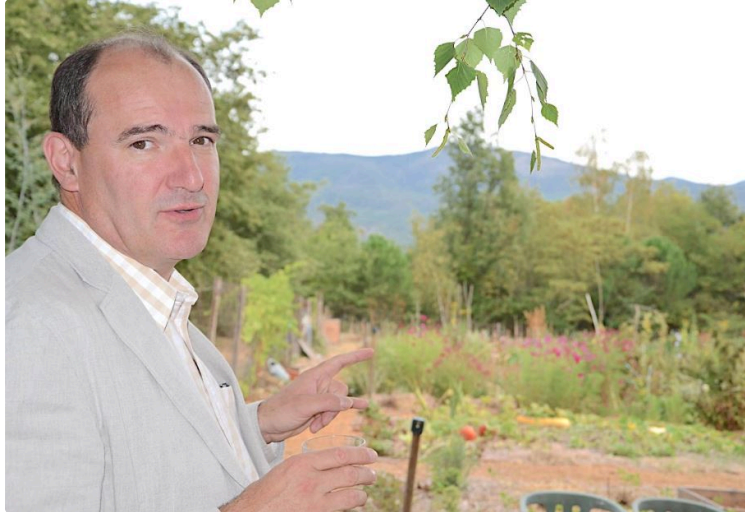
Le Vicois Jean Castex, homme clé des prochains mois