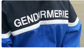
Gendarmerie : Arrivée de 4 nouveaux personnels sur le secteur