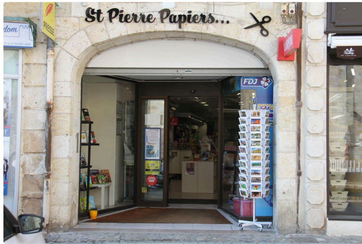
Le retour de la presse Place Saint Pierre

Une seconde ouverture pour St Pierre Papiers, définitive, cette fois, il faut l'espérer !