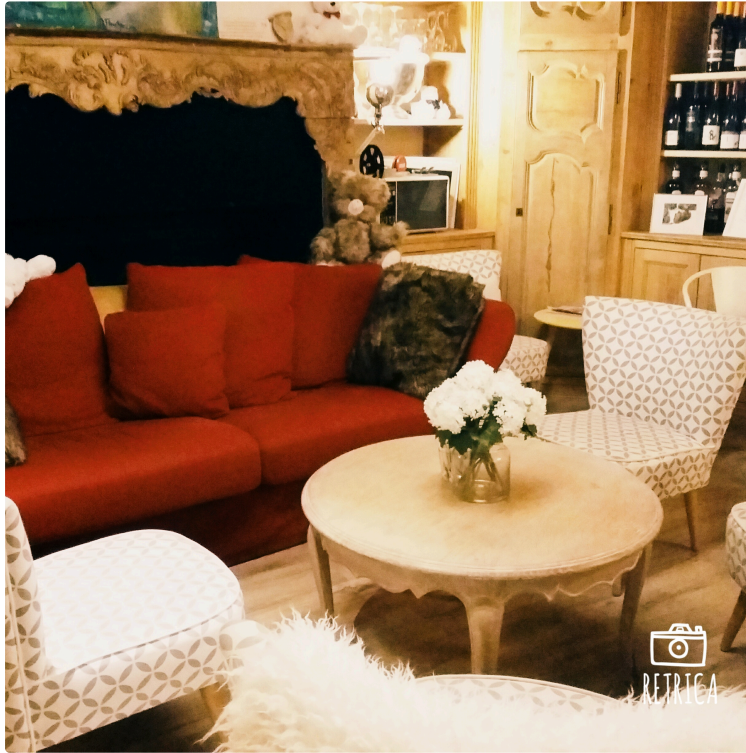
L'Ours Brun : un café culturel à la portée de tous