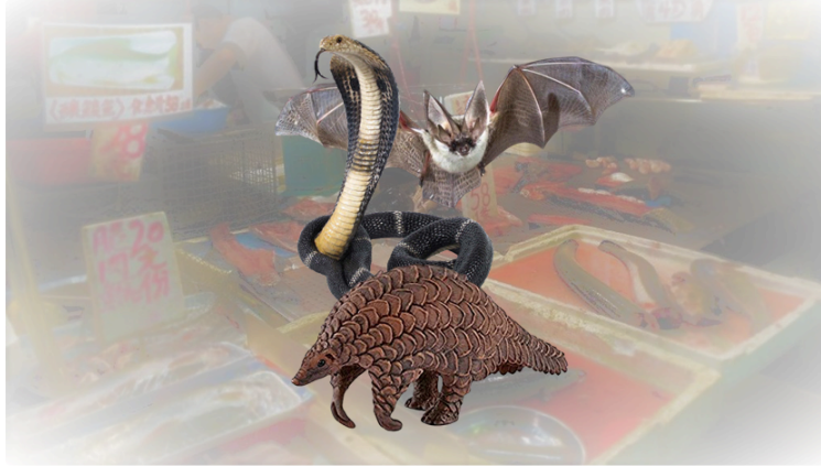
Le pangolin, la chauve-souris, et le serpent